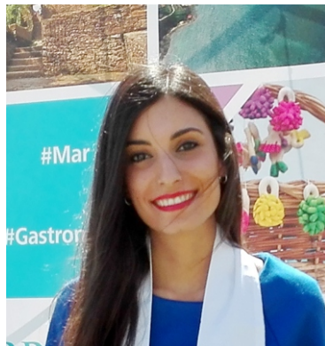
IMAGEN personal y uniformidad