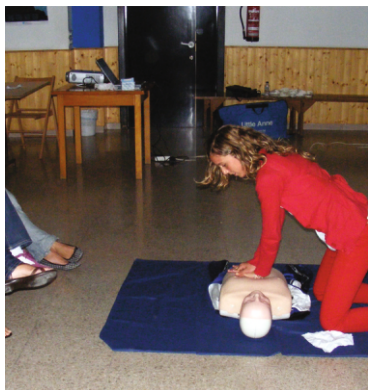
FORMACIÓN y reciclaje continuos