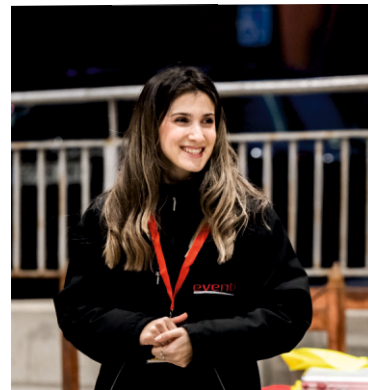
PROFESIONALIDAD y experiencia